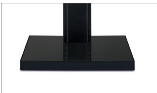
verdeckt angebrachtes Rollenset, Hochglanzoberfläche