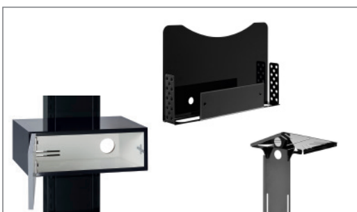
Erweiterbar durch vielfältiges Zubehör